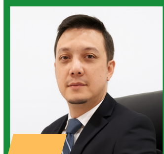
ALFATIHA BAHARNURADI Commissioner